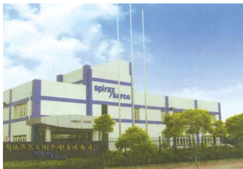
斯派莎克工程(中国)有限公司上海总部